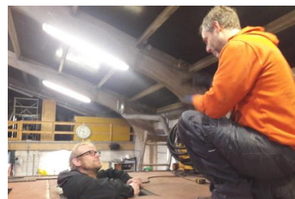
Foto 2 Keuring uit- en inwendig