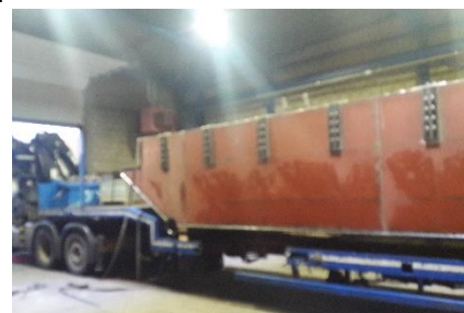
Foto 1 Drijver 1 op de dieplader

Eind 2020 is ook de Bruine Vloot Spakenburg sponsor van het project geworden. De SMWR is blij met deze ondersteuning. De vereniging is een belangrijke drager van een waardevol stuk cultuurhistorie van de voormalige Zuiderzee. Een onderstreping van het grote belang om de Randmeren bevaarbaar te houden.