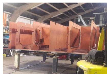
Foto 3 Spanten en schotten